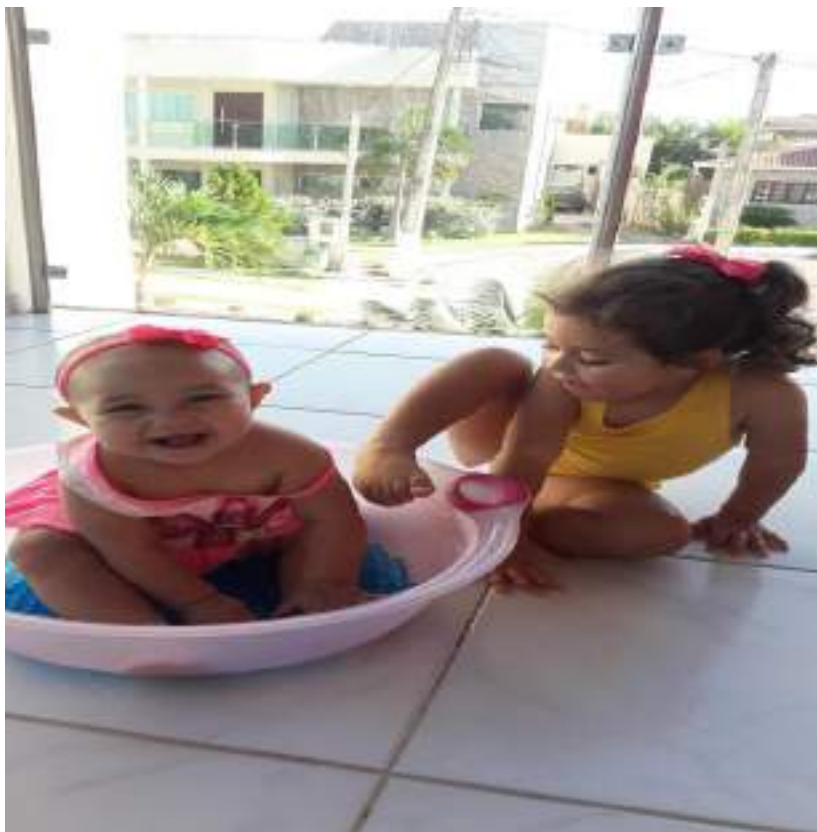
Banho de bacia com bolinhas de gel